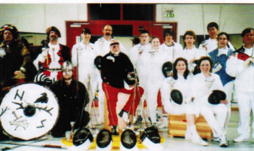
Neuer Ulmer Club mit Seniorenpower und Studentenenergie

M it Senioren-Power und Studentenenergie ist im Ulmer Vorort Wiblingen die „1. Ulmer Fecht- und 5-Kampfabteilung 08“ etabliert worden. Im Vereinszentrum des rund 1.600 Mitglieder starken TV Wiblingen haben seit März 2008 auch Fechten und fechterische Mehrkämpfe Einzug gehalten. Ein sportlich außerordentlich vielseitiges Angebot reicht vom üblichen Sportfechten (alle Waffen) über Theater- und Abenteuerfechten bis zu Showauftritten, Fitness-Fencing-Aerobic und „Cardio-Fitness-Fencing“.